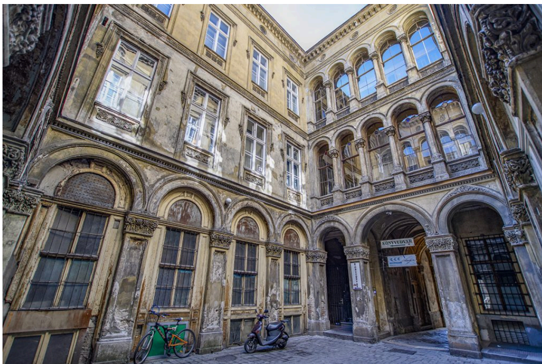
Fotó: Könyvudvar (Egy jó kép az utazásról)

könyveket fillérekért árusító Könyvudvar, ahová a Magyar utcáról, a Reáltanoda felől is betérhettek és akár választhattok is egymásnak valamit. Ha megéheznének, próbáljátok ki a kissé eldugottabb Manu+ mennyei, tradicionális nápolyi pizzáját. Figyeljétek a feliratokat, a pizzamanufaktúrát egy társasház belső udvarában találjátok.