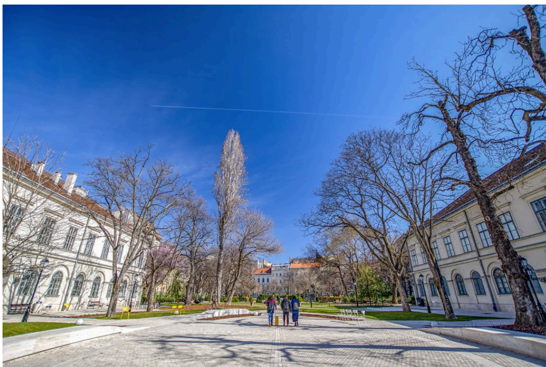
Fotó: Károlyi kert (Egy jó kép az utazásról)

A Képiró utcát elhagyva, a gasztronómiai sokszínűségéről ismert Kecskeméti utcába értek, ahonnan kőhajításra van a Károlyi utcai Petőfi Irodalmi Múzeum. Az udvarán átkelve a romantikus sétákra teremtett Károlyi-kertben találjátok magatokat. A lenyűgöző épületek ölelésében fekvő park a környék rejtett kincse, gyönyörű és nem túl zsúfolt, mondhatni andalgásért kiált!